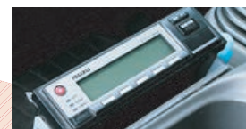
みまもりくんコントローラ

みまもりくんのデータは、 本社で集約し、 各事業所に フィードバックしています。